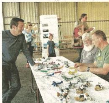
Des avions miniatures ont également été exposés