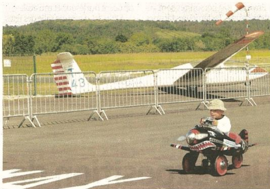
Il n'y a pas d'âge pour la passion des avions