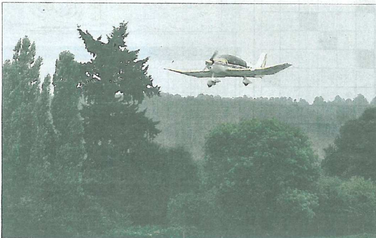
La Dordogne vu du ciel, on y découvre une mer de végétation. Du vert, du vert et encore du vert...

« Il faut comprendre comment ça marche. C'est très simple, c'est comme un avion en papier qu'on lance dans les airs. Une fois qu'on a compris ça, on a tout compris... » Viennent ensuite les histoires à émotion forte ou comment, un jour on se retrouve à atterrir avec un « Airbus au cul ». Pourquoi il faut toujours attendre un peu avant d'atterrir derrière l'avion de ligne pour ne pas « se prendre les tourbillons ». « Vous savez, ces avions sont construits en bois et en toile, on ne dirait pas hein ? »