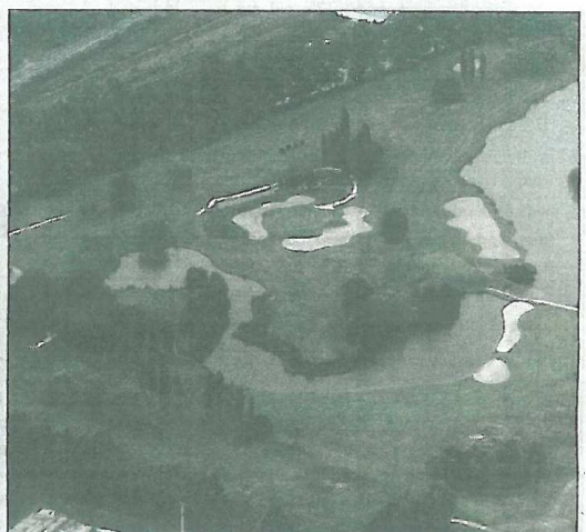
Parmi les beautés à découvrir autour de Périgueux, le golf de Saltgourde.