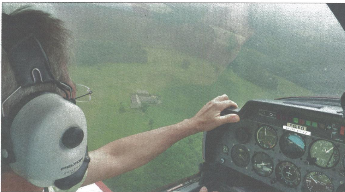
Les bénévoles des aéroclubs accueilleront le public tout le week-end pour faire découvrir les joies du pilotage. Pour les Périgourdins, rendez-vous sur l'aéroport de Bassillac.

Des conventions sont passées entre les aéroclubs et certains lycées du département (Saint-Joseph et Bertran-de-Born à Périgueux) pour proposer aux élèves de passer le Brevet d'initiation à l'aéronautique (BIA). Tout au long de l'année scolaire, les élèves reçoivent des cours théoriques de la part d'un pilote licencié. La formation est sanctionnée par un examen au mois de mai. Entre 100 et 150 jeunes prennent part chaque année à