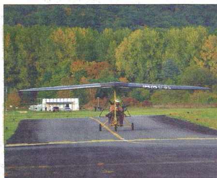
Au décollage, l'ULM prend une vitesse de 90 km/h.

contrôle et voilà l'engin qui s'engage. Première surprise, la poussée au décollage est assez forte - 90 km/h - et il ne faut pas très longtemps à l'ULM pour décoller et prendre de l'altitude. Dans les airs, à 1 000 pieds d'altitude (soit environ 300 mètres), je fais le plein de sensations. Ce ne sont pas les mêmes repères qu'en avion où l'on est entouré d'une carlingue et d'un cockpit. Je suis à l'air libre, comme un oiseau, avec le vent en pleine face.